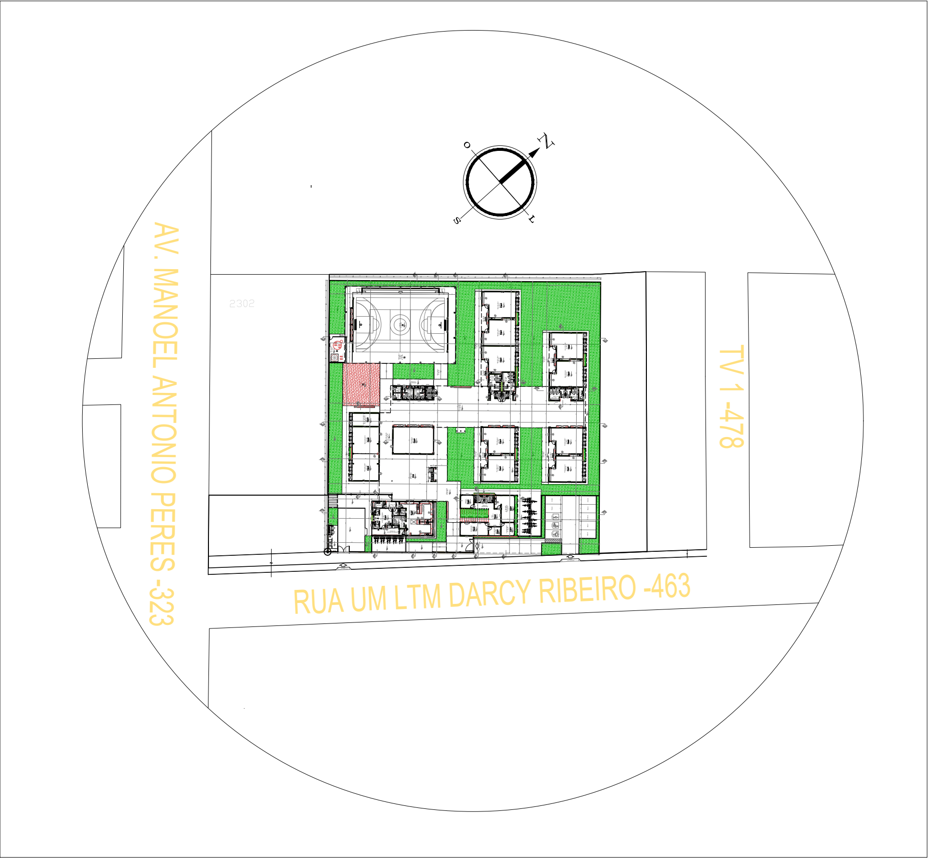
PLANTA DE IMPLANTAÇÃO E LOCALIZAÇÃO esc. 1/100

NOTAS - MEDIDAS E NÍVEIS EM METROS. - VERIFICAR POSIÇÃO EXATA DOS PILARES NO PROJETO ESTRUTURAL. - VERIFICAR DETALHES CONSTRUTIVOS PERTINENTES NAS PRANCHAS DE DETALHAMENTO. - EM CASO DE CONFLITO DE INFORMAÇÕES ENTRE O PROJETO GRÁFICO E O MEMORIAL DESCRITIVO, PREVALECE A INFORMAÇÃO CONTIDA NOS DESENHOS. - ALTERAÇÕES NESTE PROJETO SOMENTE COM AUTORIZAÇÃO EXPRESSA DO FNDE REFERÊNCIAS: - PLANILHA DE QUANTITATIVOS - MEMORIAL DESCRITIVO E ESPECIFICAÇÕES TÉCNICAS (MARCAS/ FABRICANTES DE MATERIAIS RELACIONADOS AOS PROJETOS CONSTITUEM-SE APENAS COMO REFERÊNCIA. O FNDE NÃO DIRECIONA A ESCOLHA DE MARCAS E NÃO MANTÉM CADASTRO DE FABRICANTES).